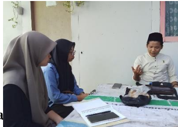
Gambar 1. Interaksi di sini

Berdasarkan temuan tersebut dapat disimpulkan bahwa keberhasilan pembentukan karakter peserta didik di era digital tidak hanya bergantung pada kompetensi guru PAI, tetapi juga pada kemampuan seluruh pihak dalam memanfaatkan teknologi secara positif. Guru PAI berperan sebagai agen perubahan yang membantu peserta didik mengembangkan karakter religius, disiplin, tanggung jawab, dan etika bermedia digital yang baik (Munawir, Rohmah, & Hamidah, 2025).